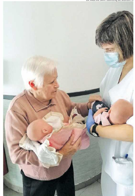
Una resident i una professional de la Vall amb nines a les mans