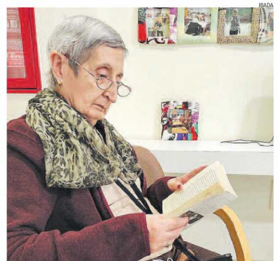
Temps de lectura a la residència Ibada