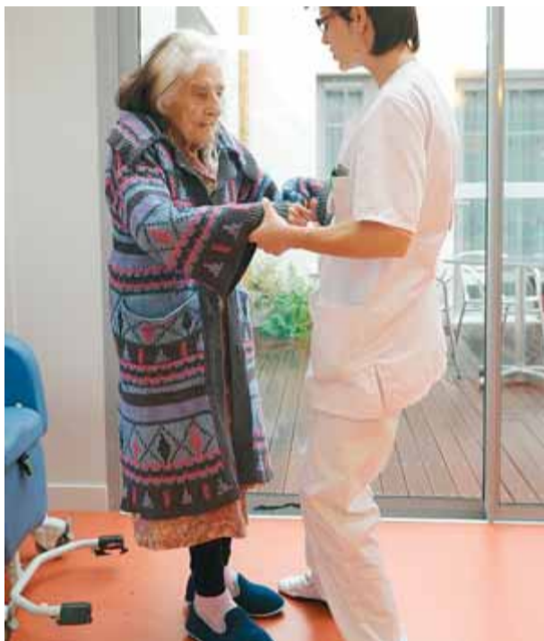
Una àvia que és gran dependent que viu ingressada en una residència