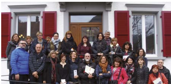
Visita al Centre de Dia Valse du Temps