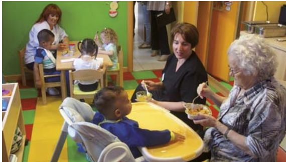
Espai intergeneracional del Centre Residencial Joviar