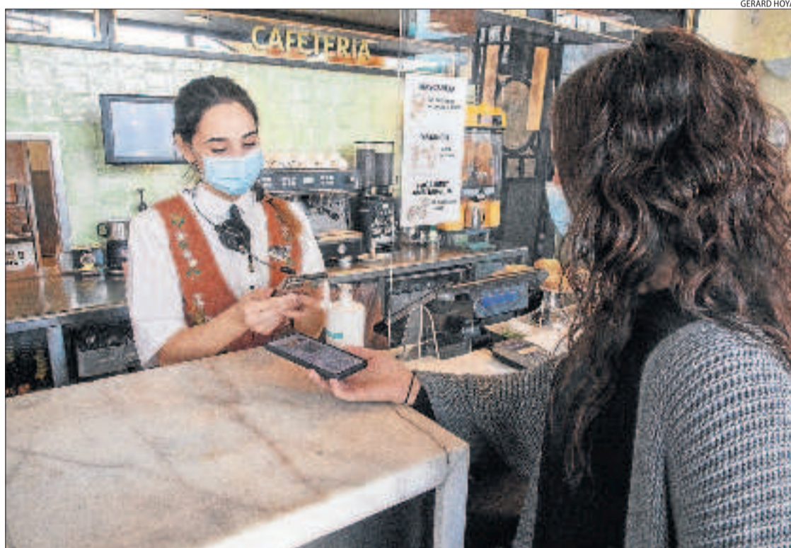
Ahir va ser l'últim dia en què els restaurants havien de demanar el certificat Covid.