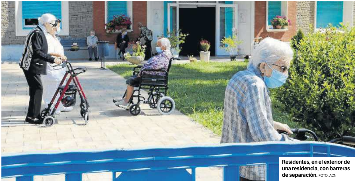
Residentes, en el exterior de una residencia, con barreras de separación.