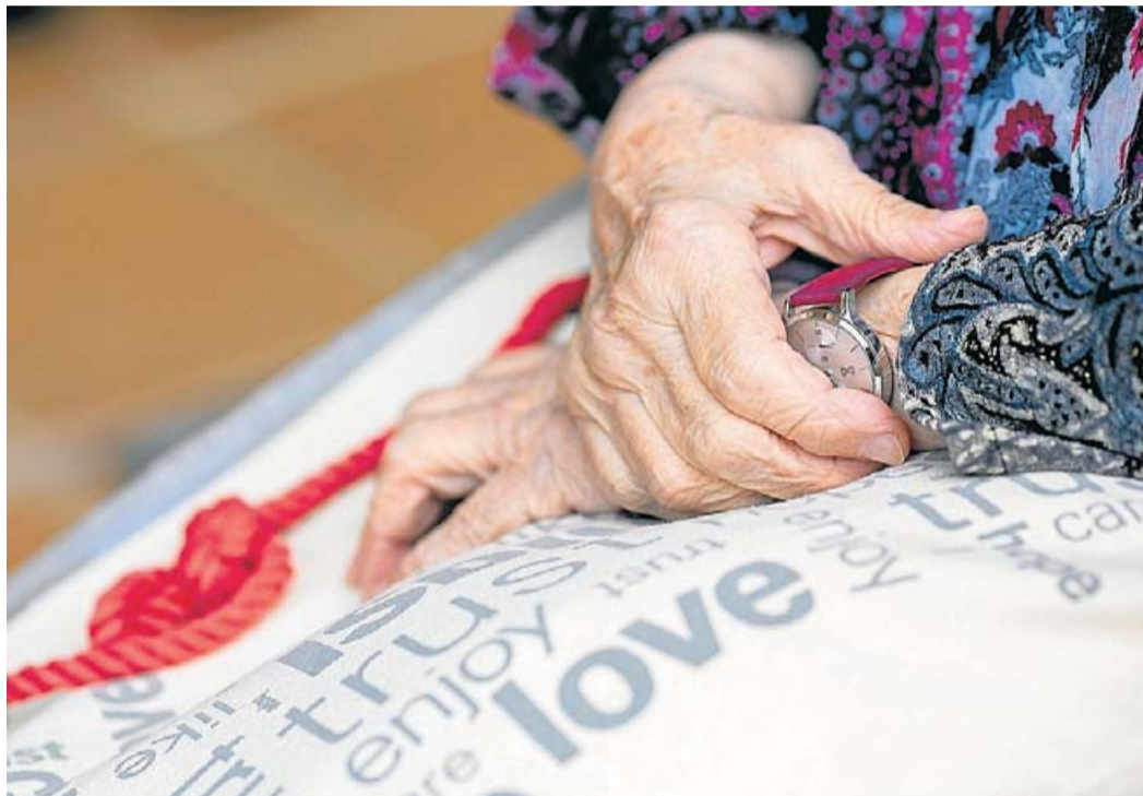
Una usuària de la residència de gent gran Les Oliveres, de Sant Gregori.