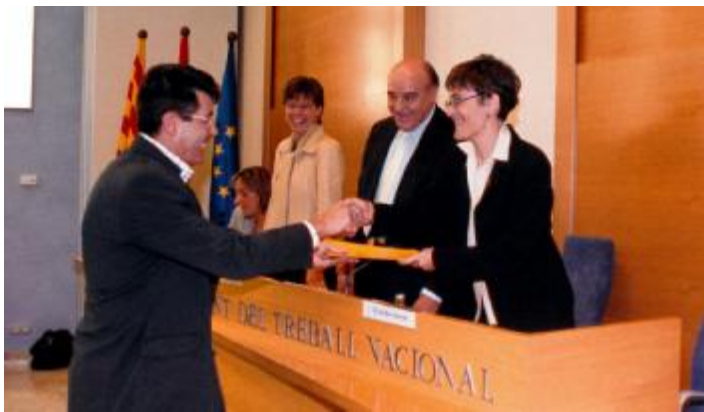
Durant l'acte, van lliurar-se els diplomes de la primera i segona promoció