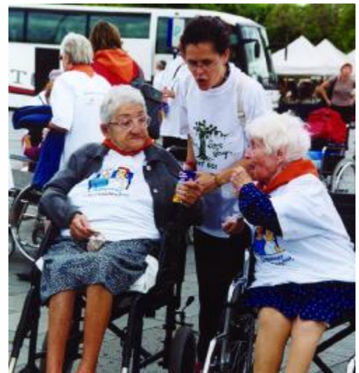
La tasca de familiars i voluntaris va ser clau

L'activitat va començar de bon matí. Entre les nou i les deu, els autocars adaptats van recollir a cada centre els usuaris i els acompanyants. A dos quarts d'onze, van reunir-se al port de Barcelona i van passejar a bord de les golondrines. Tot seguit, van tornar als autocars i van fer un tomb per la ciutat, aprofitant l'any Gaudí. El trajecte va finalitzar a l'Estació del Nord, que va acollir el dinar. Després, pels volts de les quatre, un grup musical va amenitzar la sobretaula fins que, a les cinc, els participants van ser conduïts de nou als seus centres. ACRA creu fermament que iniciatives d'aquest tipus permeten donar visibilitat a la malaltia i transmetre a la ciutadania que és un problema que ens afecta a tots. Des del respecte, l'estima i la qualitat assistencial, pot millorar molt la vida d'aquestes persones.