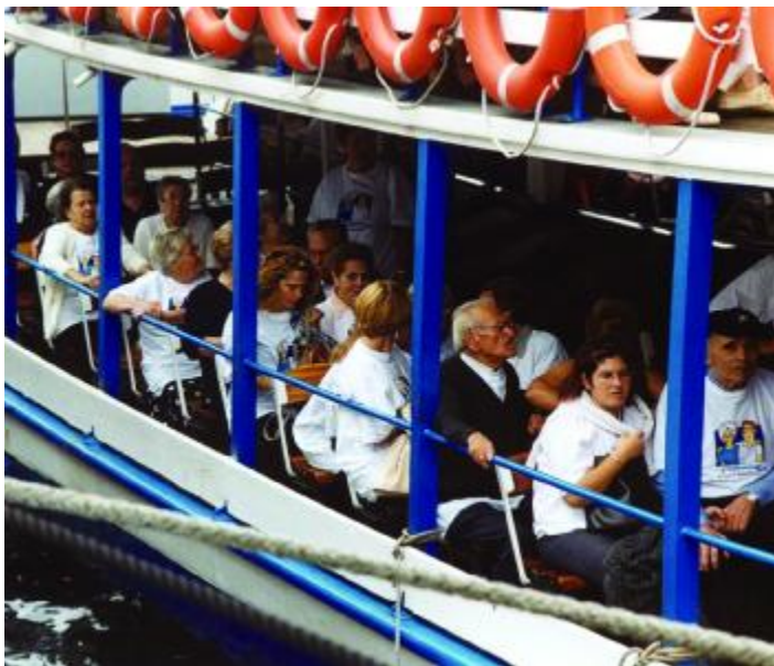
Els residents van fer un volt a bord de la "golondrina"