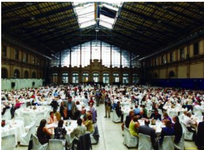
El menjador va ubicar-se a l'Estació del Nord

ACRA va col·laborar en la celebració del Dia Mundial de l'Alzheimer el passat 21 de setembre. Gairebé 340 persones, entre residents, familiars i voluntaris, vinculades a l'associació van sumar-se a l'acte lúdic i de conscienciació social que va tenir lloc a Barcelona sota el lema "El malalt d'Alzheimer pot, si tu l'ajudes" i que va aplegar uns 1300 participants.