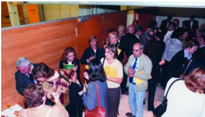
Al final del matí, va servir-se un aperitiu per gentilesa de Ferrer & Ojeda