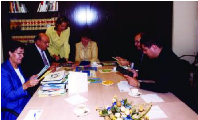
Dues instantànies del jurat durant la deliberació