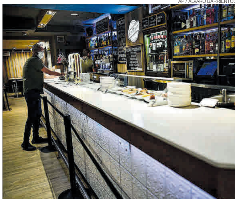
► Un trabajador con mascarilla en un bar de Pamplona, ayer.

Como puede comprobarse, no es necesario alcanzar el nivel de alerta máxima para tener que promover medidas drásticas que en la actualidad no se aplican en ningún territorio, como limitar el transporte público al 30% del aforo. Deberían hacerlo todas las poblaciones que se encontraran en riesgo alto. Sería el caso, por ejemplo, de las que superaran una incidencia superior a una incidencia de 150 casos,