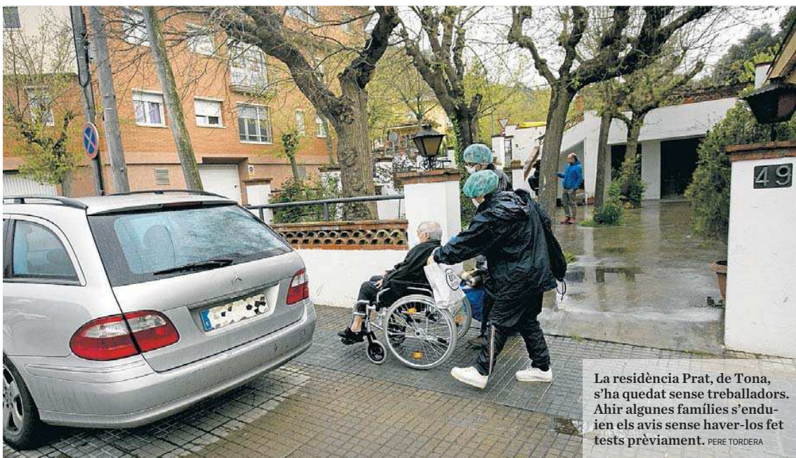
La residència Prat, de Tona, s'ha quedat sense treballadors. Ahir algunes famílies s'enduien els avis sense haver-los fet tests prèviament.