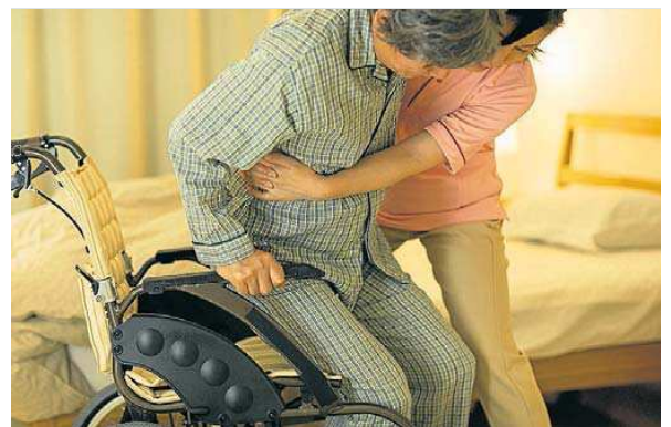
Una cuidadora ajudant una persona gran en una imatge d'arxiu.

La Taula del Tercer Sector Social assegura que està en contacte permanent amb la Generalitat i que espera una resposta urgent. De moment, ahir l'Ajuntament de Barcelona anunciava que el material per a tot el servei domiciliari arribarà avui mateix.