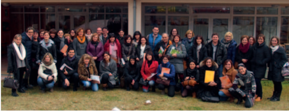
Missió empresarial a Sant Hilari Sacalm