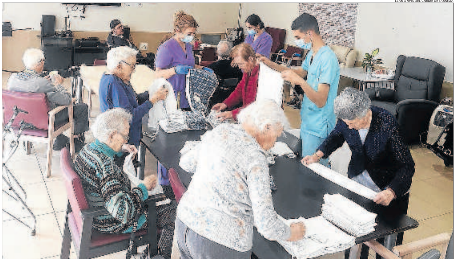
LLAR D'AVIS DEL CARME DE TÀRREGA

La Generalitat apunta que "hi ha evidències dels seus bons resultats, com la disminució de l'ingrés hospitalari, la