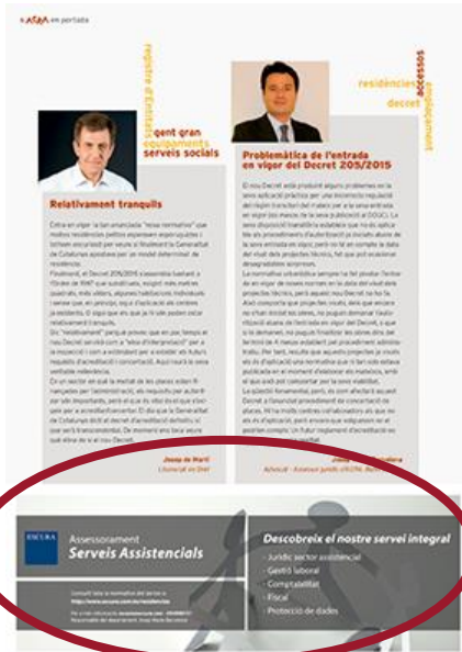
¼ de pàgina