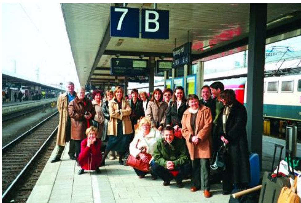
L'expedició d'ACRA a Alemanya

l'èxit del model. Les persones grans ingressades s'agrupen en petits nuclis de sis, amb cuina i menjador propi, en