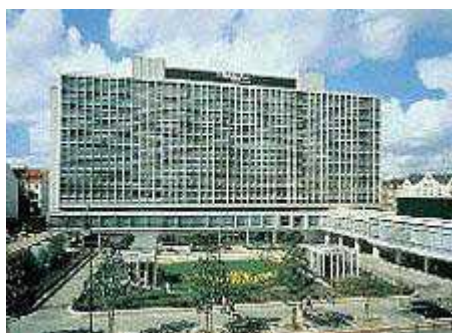
Hotel Crown Plaza (Colònia)

Diversos representants d'entitats associades a ACRA viatjaran a Alemanya entre el 21 i el 26 de març per conèixer la política social del país i per visitar diferents tipus de centres residencials, així com la fira