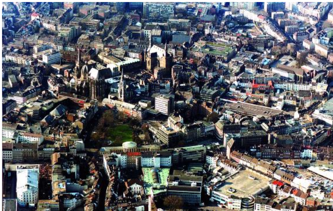
Vista aèria d' Aachen

D'altra banda, ja el dia 24, tindrà lloc una trobada a Colònia amb un representant del Ministeri de Família, Gent Gran i Assumptes Socials del land de Westfàlia del Nord. Després, el focus d'atenció se centrarà en la fira Altenpflege Health Care de Nüremberg. Entre d'altres activitats, l'expedició assistirà a la jornada "Assistència amb