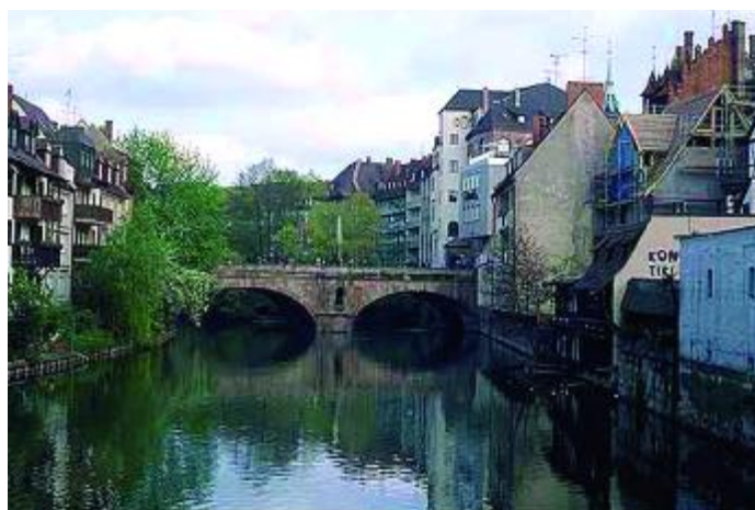
Imatge de Nuremberg

El recorregut començarà a Aachen, on es visitarà l'Alten und Pflegeheim Haus Kohlscheid, un centre d'assistència privat amb 20 anys d'experiència i inspirat en models nord-americans que té convenis amb les mútues alemanyes (AOK, BKK, IKK) i assegurances obligatòries. També acull clients en règim privat. Disposa d'una àmplia oferta de serveis, assistència a domicili inclosa, i de "Senioren-Parks", grups de petits habitatges individuals per als clients que ho desitgin amb una atenció mèdica i de serveis completa.