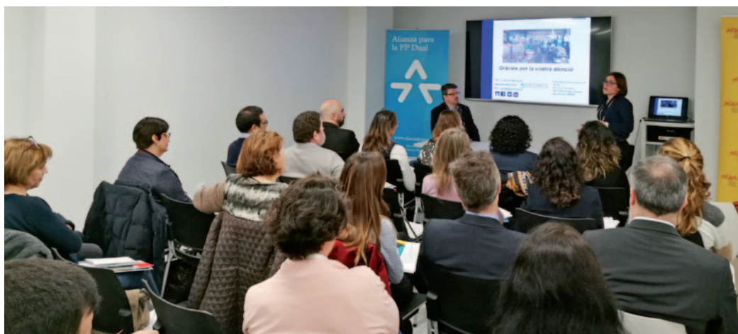
Durant la presentació oficial del passat gener es van mostrar dos casos d'èxit d'FP Dual en el sector industrial, i l'experiència de l'Institut Ferran Tallada, que participarà del projecte d'FP Dual en el sector de la dependència.

ACRA i la Fundació Bertelsmann acorden un projecte per impulsar un model de formació de qualitat, adaptat a les necessitats de les empreses i els alumnes, i que acabi aportant personal qualificat