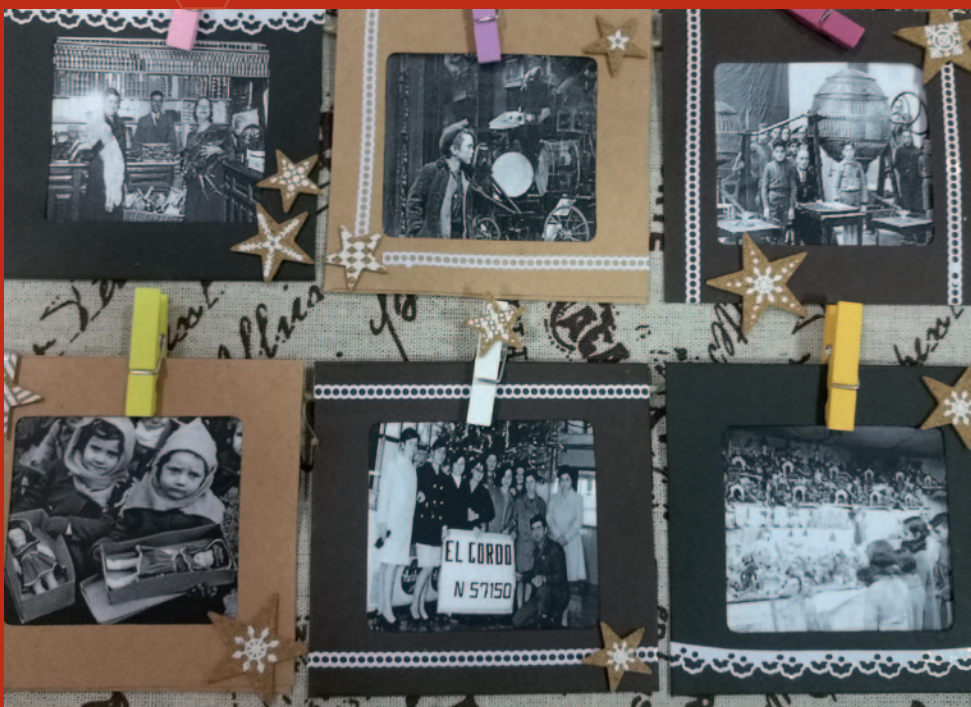
"Les nostres tradicions" (Residència Parc del Clot - Barcelona)