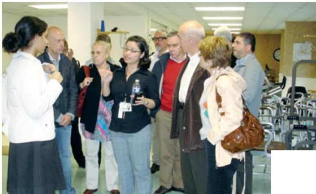
Els participants de la missió van visitar 13 serveis i organismes relacionats amb la gent gran

Cada centre funciona com una gran casa particular on l'eix principal són les persones que hi conviuen, tant usuaris com cuidadors.